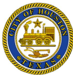
Mayor Sylvester Turner

通过提高对当地法规的认识、向当局举报违规者并协助进行社区美化工作，社区成员在帮助本市解决违法垃圾倾倒问题方面发挥了重要作用。您可以按照 CLEAN 的方法参与：关心、学习、参与、责任感、永不停息 (Care, Learn, Engage, Accountability, Never stop)。